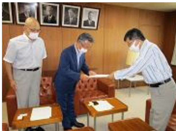
議長要望の様子(波多野副議長様も同席)