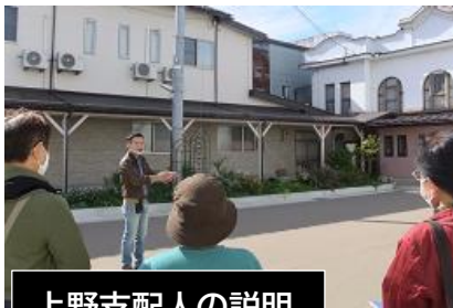
上野支配人の説明