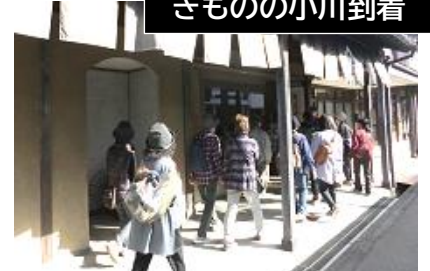
きものの小川到着