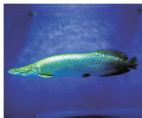
改築される水族博物館でのピラルク最後の勇姿! お疲れ様でした。